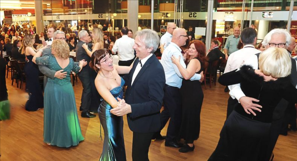
Die Tanzfläche war den ganzen Abend über gut gefüllt.