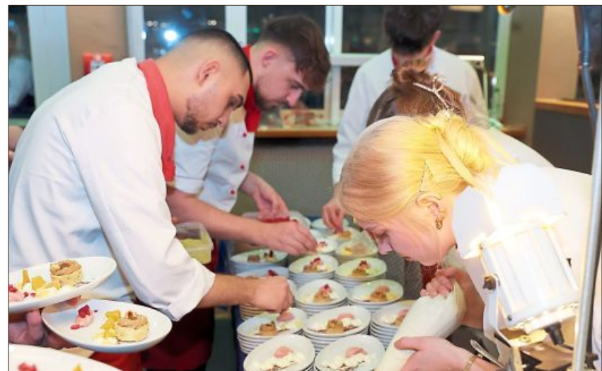
An vier Stationen konnten sich die Gäste die Köstlichkeiten abholen.