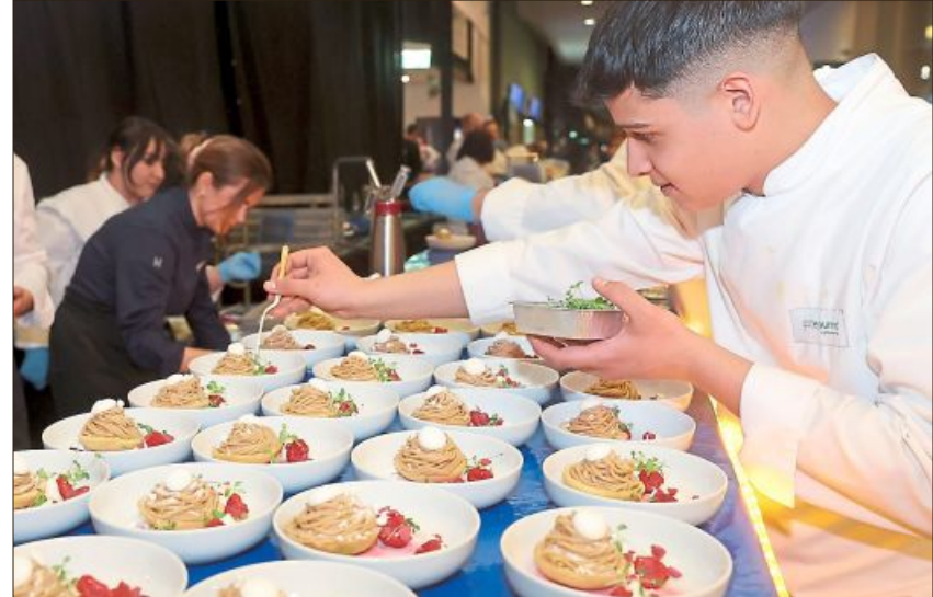
Auch Azubis legten bei der Vorbereitung der Gerichte mit Hand an. Gerade für sie war es ein besonderer Abend.

Für musikalische Untermalung und Unterhaltung sorgte die Band Pianissimo aus München, die mit vielen bekannten Liedern stets zahlreiche Besucher auf die Tanzfläche lockte. Und zum Ausklang des Ballabends zeigte schließlich noch die Showtanz-Gruppe „Dance United“ aus Wartenberg ihr Können. (skl)